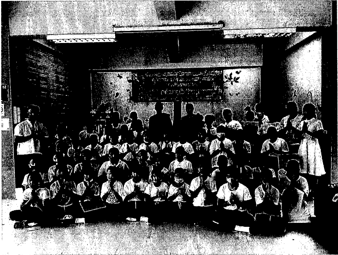
ภาพกิจกรรมส่งเสริมคุณธรรม จริยธรรม ปี ๒๕๖๓