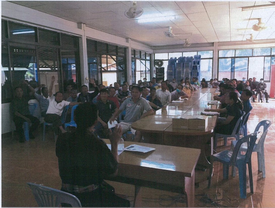
รูปภาพประชาคมขอเลี้ยงหมู หมู่ ๑ วันที่ ๑๓ มีนาคม ๒๕๖๓ ณ วัดท่าตันตัน